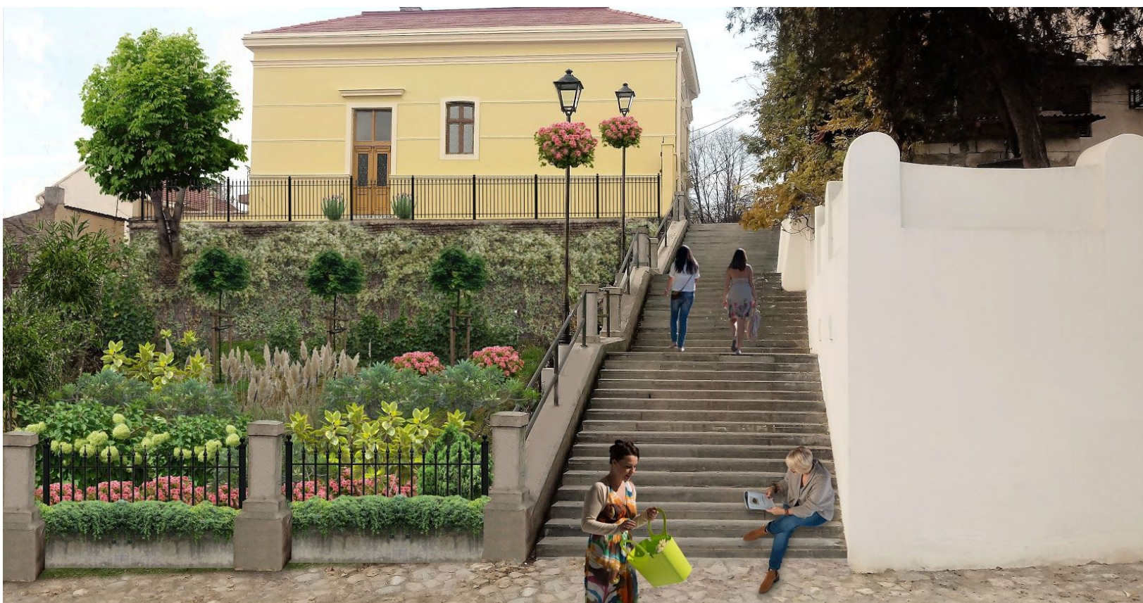
Urbana bašta na Kosančićevom vencu – Koncept (2017)